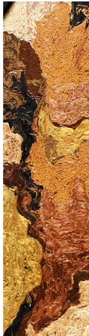
Tilko, créatrice textile

Tous les jeudis, des artisans exposants seront présents de 17h à 19h à la Galerie Decorde pour partager des moments d'échanges avec le public.