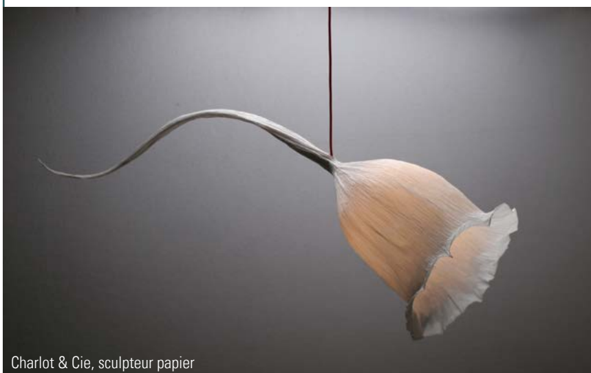
Charlot & Cie, sculpteur papier

Tous nos visuels sont en téléchargement dans la rubrique Presse sur www.salon-resonances.com