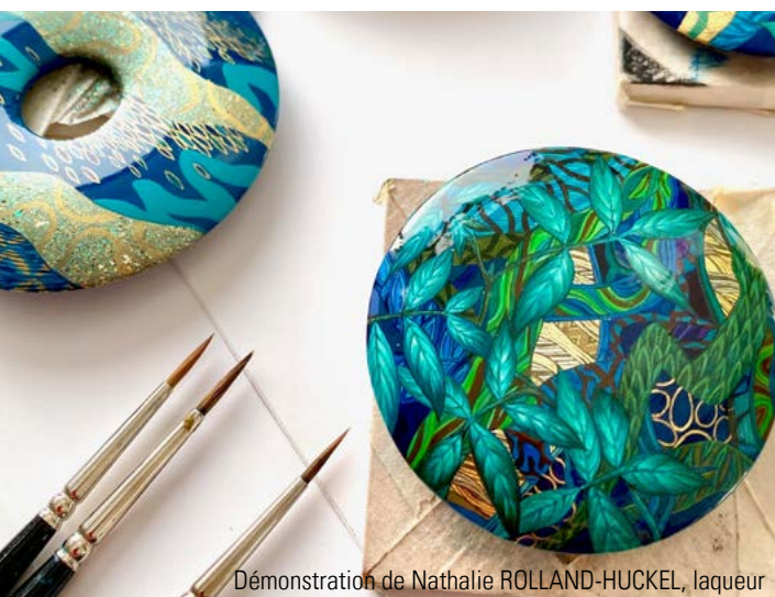
Démonstration de Nathalie ROLLAND-HUCKEL, laqueur

Et enfin, trois créateurs se prêtent à nouveau au jeu de la démonstration en direct , commentée et projetée sur grand écran, pour dévoiler les secrets de leur métier au grand public mais aussi répondre à leurs questions pour un moment convivial et intimiste.