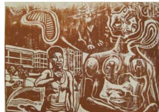
Gravure d'Aymery Rolland