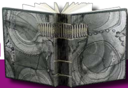
Reliure de Maurice Salmon