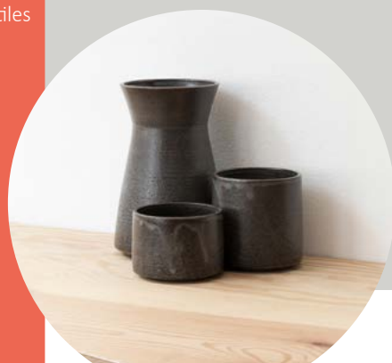
Laurence Labbé - Céramiste

Du 14 au 23 décembre 2018 Grande Salle de l'Aubette Place Kléber à Strasbourg Ouvret tous les jours de 10h à 19h Entrée libre www.fremaa.com